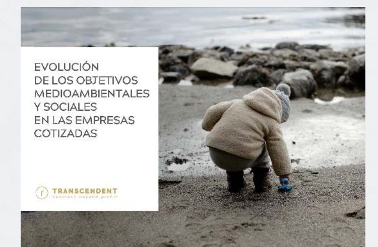
OBJETIVOS SOCIALES Y MEDIOAMBIENTALES EN LAS EMPRESAS COTIZADAS