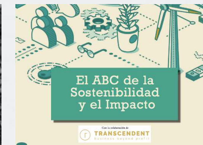
EL ABC DE LA SOSTENIBILIDAD Y EL IMPACTO