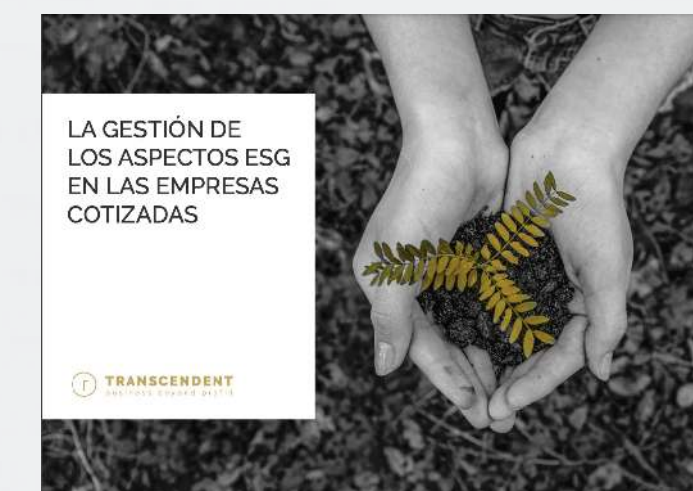
LA GESTIÓN DE LOS ASPECTOS ESG EN LAS EMPRESAS COTIZADAS

En 2022, hemos trabajado en más de 20 artículos propios, de los cuales la mitad en periódicos especializados en sostenibilidad y hemos elaborado 3 informes que han alcanzado más de 1 millón de usuarios únicos. A través de nuestras publicaciones, hemos obtenido más de 50 impactos en medios. Estas publicaciones son una oportunidad para compartir nuestra perspectiva y nuestros valores con otros actores clave, y nos permiten difundir la importancia de temas como la sostenibilidad ambiental y social y contribuir a la generación de nuevas ideas.